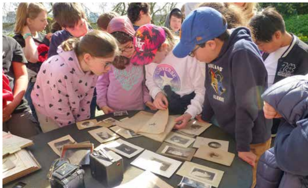
Sortie n°1 - Domaine de Saint-Cloud

Présentation du projet artistique et petite histoire de la photographie